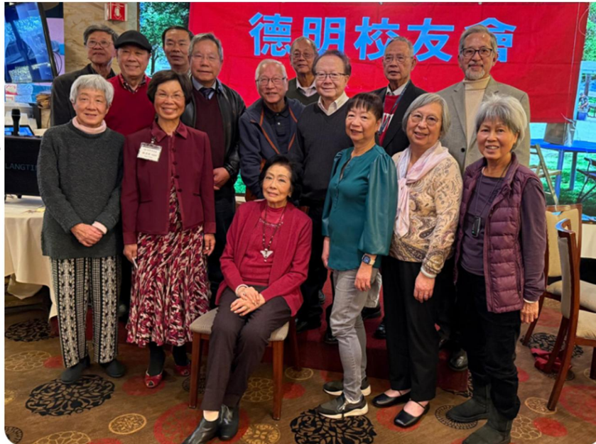
師母與現屆理事會